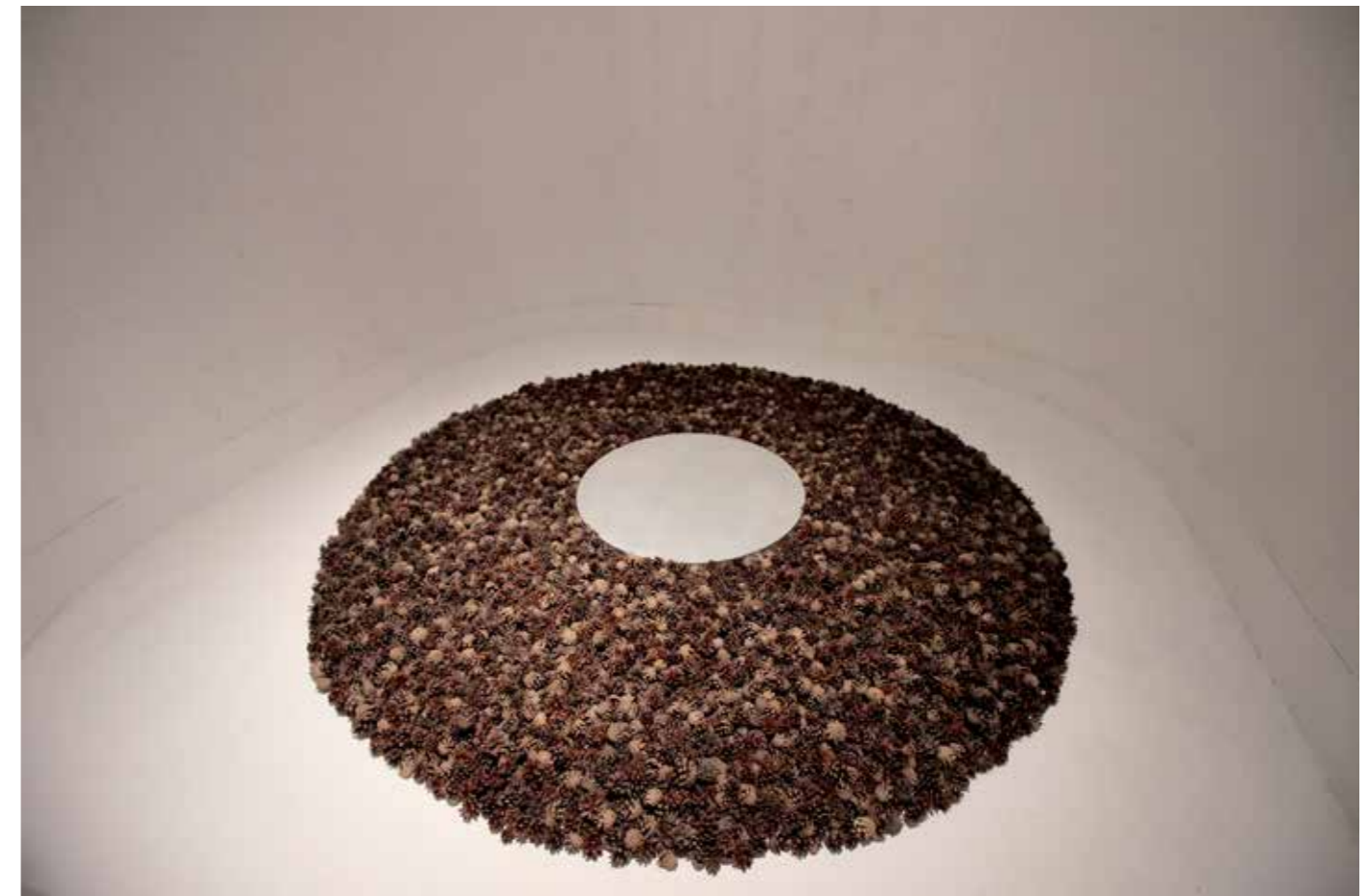
Terje Roalkvam, CIRCULUS SILVESTRIS (2016), fra Sommarutstillinga «Spor», 2017. Furukongler og aluminium.