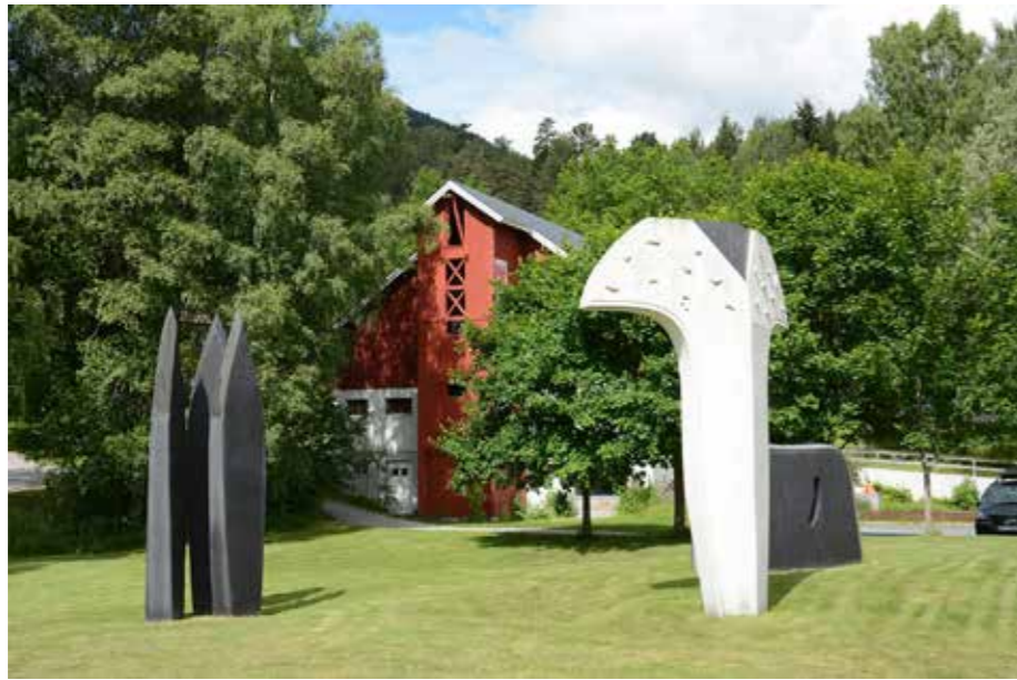
Skulpturer utenfor Kunstlåven, Sigrun Grøstad/Torhild Grøstad, Austenfor sol og vestanfor måne (1994). Betong og metall.