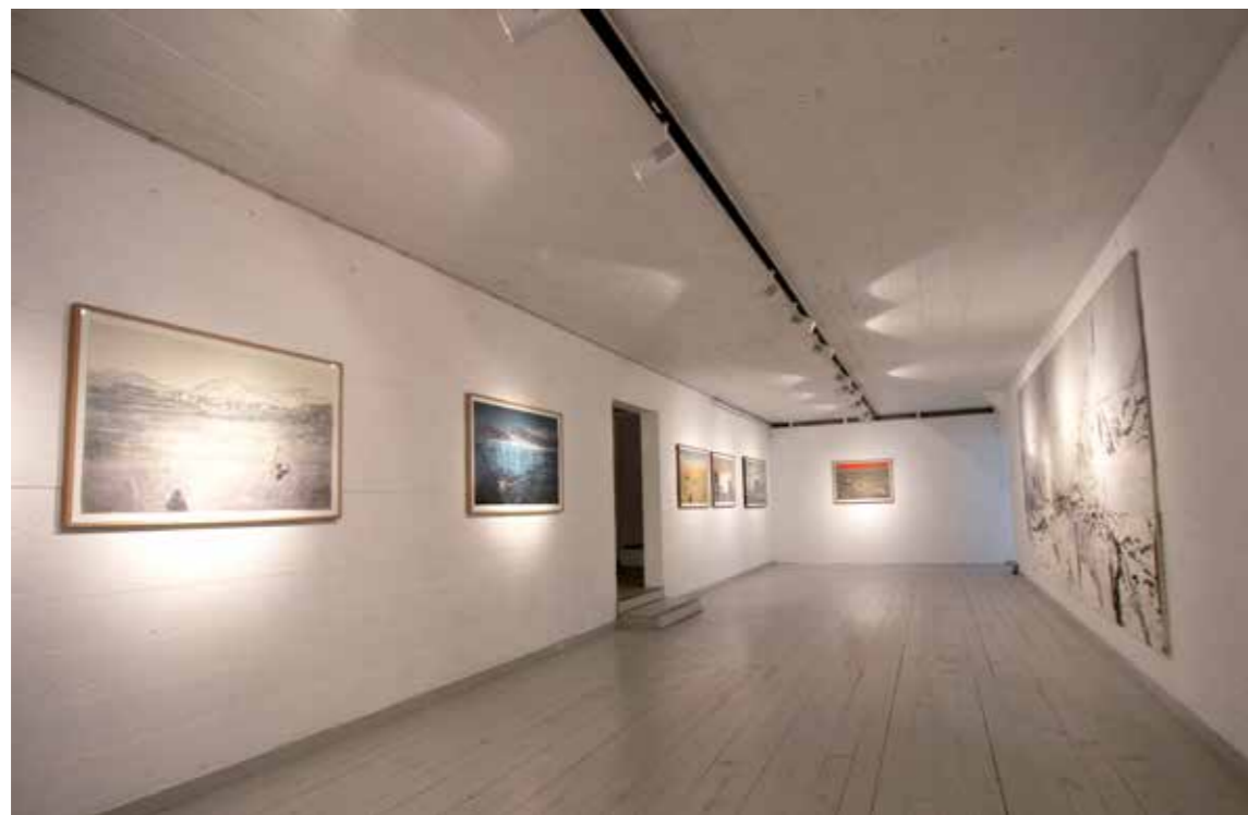
Fra Sommerutstillinga 2017, «Spor» med Ellen Karin Mæhlum